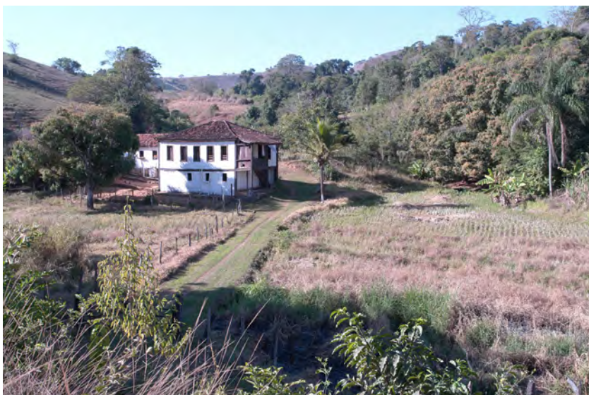
Lá em casa... Fazenda Paraopeba - Entre Folhas - MG. 1951-1963